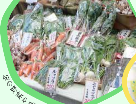
旬の新鮮な野菜 新米