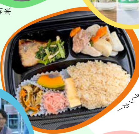
お弁当やスイーツ